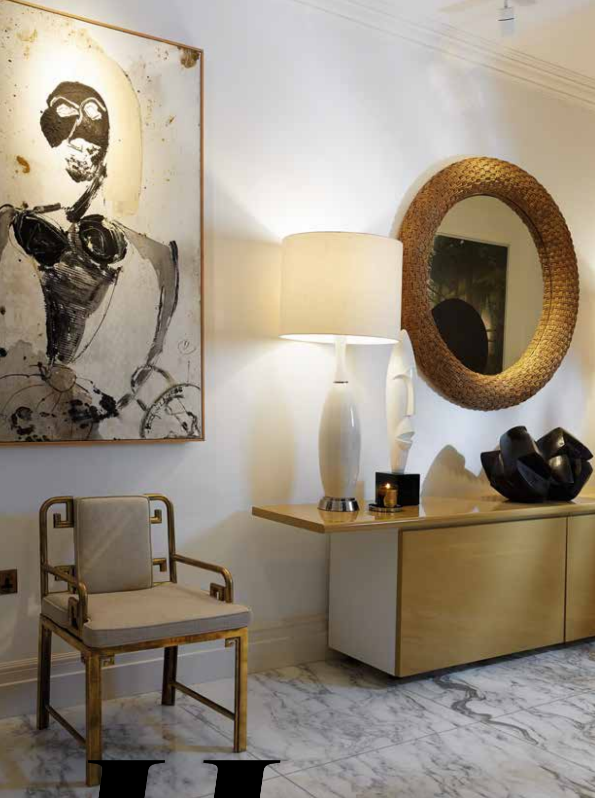
De hal in het huis van Legrand is acht meter lang en net een kunstgalerie. Het olieverfschilderij is van Philippe Pastor en komt uit de serie Les Salopes. Spiegel en stoelen Greek Keys Mastercraft van Talisman London. Bronzen sculptuur van Keith James uit de jaren zestig.

label op een stijl niet belangrijk. Ik houd van sophistication , een chique uitstraling met mooie materialen. Dat kun je glamoereus noemen, maar het hoeft niet. De mensen waarvoor ik ontwerp, voeren dat gevoel door in hun hele leven. Ze houden van mooie kwalitatieve kleding, goed eten, oftewel het goede leven. Daar hoeft je trouwens niet eens heel rijk voor te zijn.'