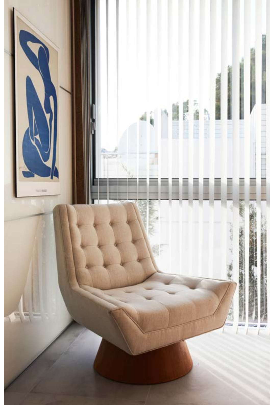
De Whitaker Chair is van Jonathan Adler. De blindingen komen van D-Shop Ibiza.

“IK WAS METEEN DOL OP HET HUIS, DE LOCATIE, DE ARCHITECTUUR EN DE ENERGIE DIE ER HEERSTE”