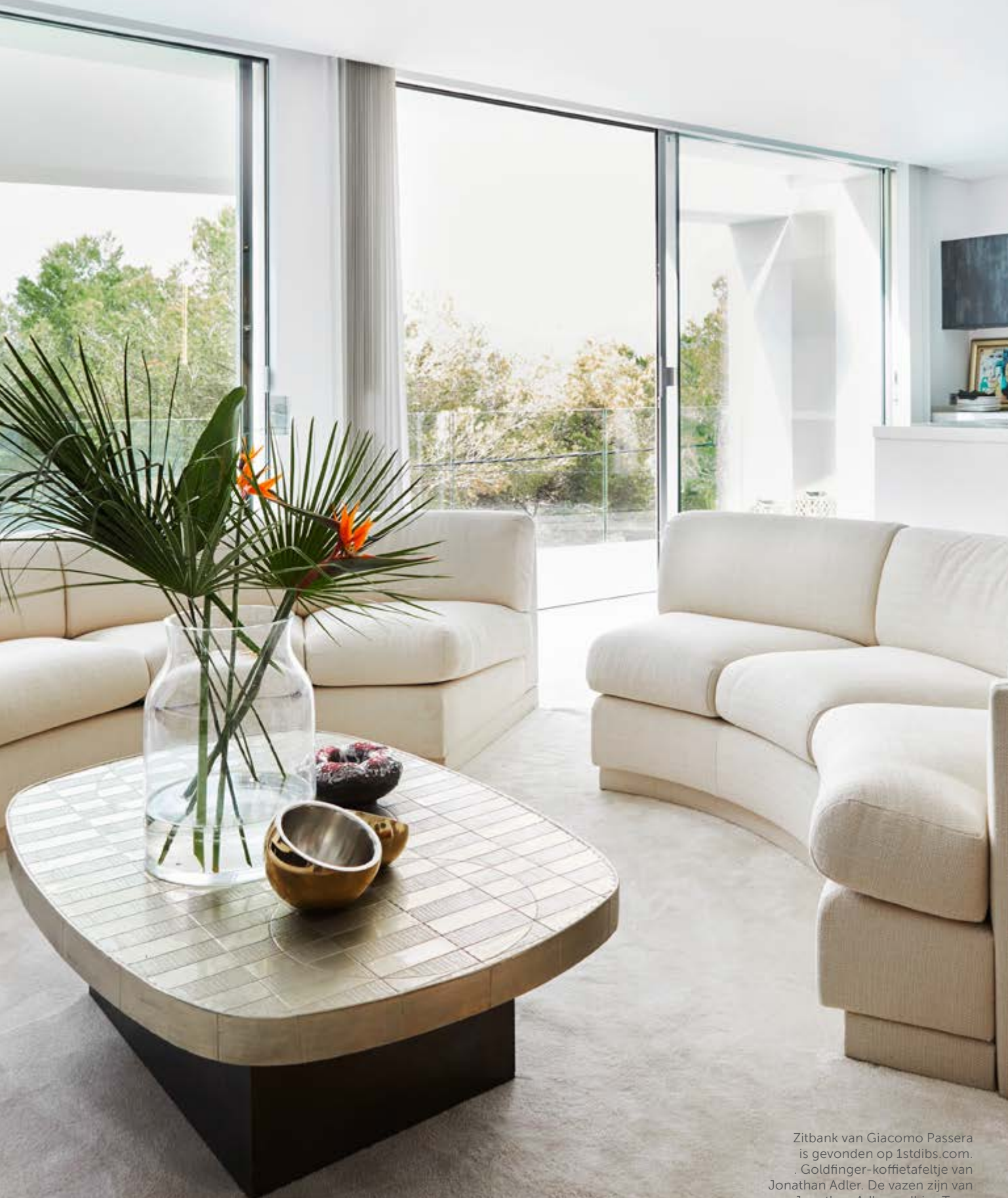
Zitbank van Giacomo Passera is gevonden op 1stdibs.com. Goldfinger-koffietafelje van Jonathan Adler. De vazen zijn van Jonathan Adler en Ibiza Troc.

“MET ALLE VIERKANTE VORMEN IN HET HUIS WILDE IK DE PERFECTE, SENSATIONELE, RONDE BANK VINDEN”